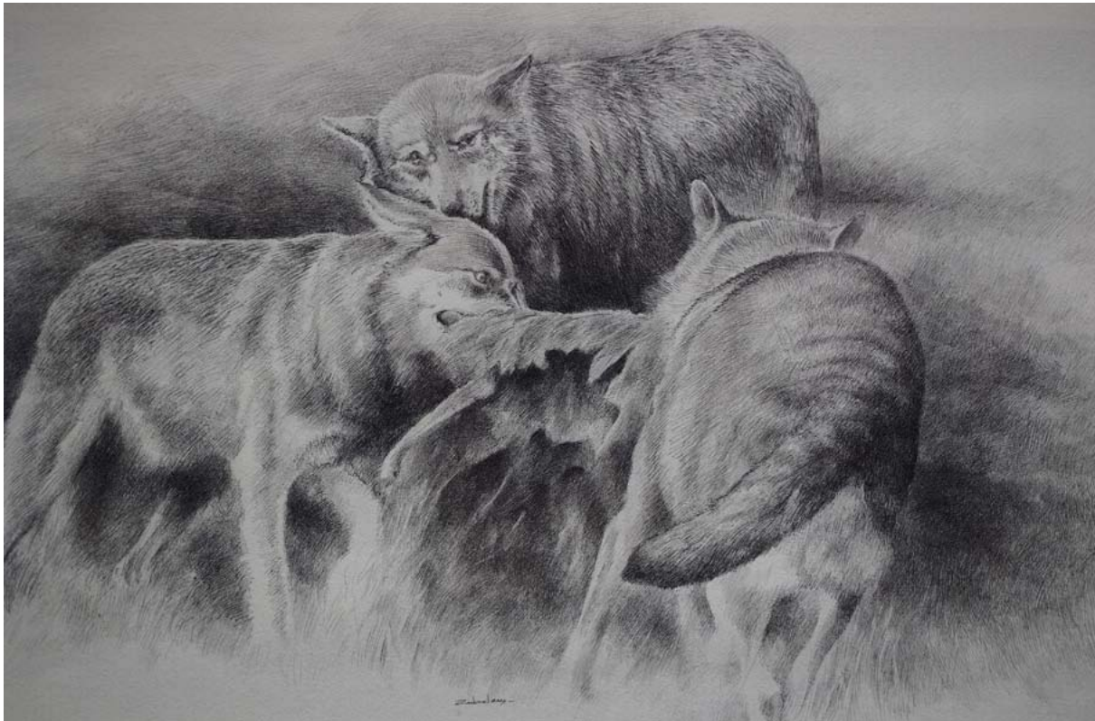
El lobo ibérico tiene un protagonismo especial en la exposición/ Jorge A. Murillo

“La serie Resistencias se compone de 20 dibujos de aves e insectos que se posan sobre estacas de madera, simbolizando ese intento de aferrarse a la vida para no llegar a desaparecer”