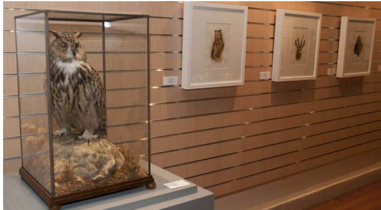
Los ejemplares de la colección del Museo conviven con la obras de Zubelzu en la muestra.

rinero y que ahora es mi estudio. Porque como bien dijo Rembrandt basta con “elegir sólo una maestra: la naturaleza”.