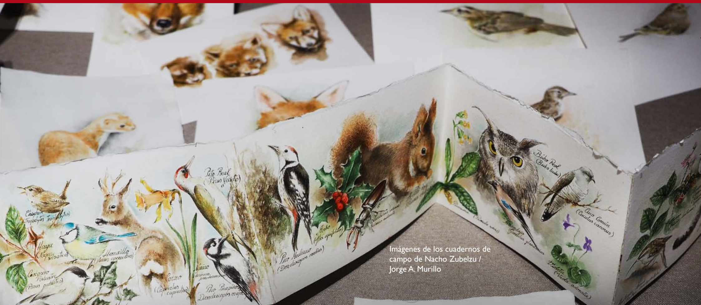
Imágenes de los cuadernos de campo de Nacho Zubelzu / Jorge A. Murillo