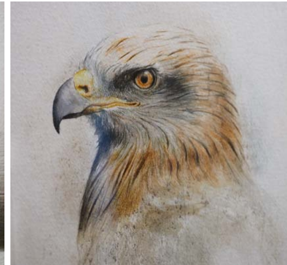
Tres de las obras de Nacho Zubelzu: Un oso pardo, un caracol y un águila

das”, invitando a la reflexión sobre ese gran patrimonio natural que el hombre debe conservar. El lobo ibérico tiene un protagonismo especial en otras series, en ella, juego con el movimiento, los colores y el potencial creativo de esta especie. Por último, en la serie “Pelo y Pluma”, investigo con la figura de seis mamíferos y seis aves, y construyo con sutileza la textura de su pelaje. También hay una exhibición de Cuadernos de Campo, que